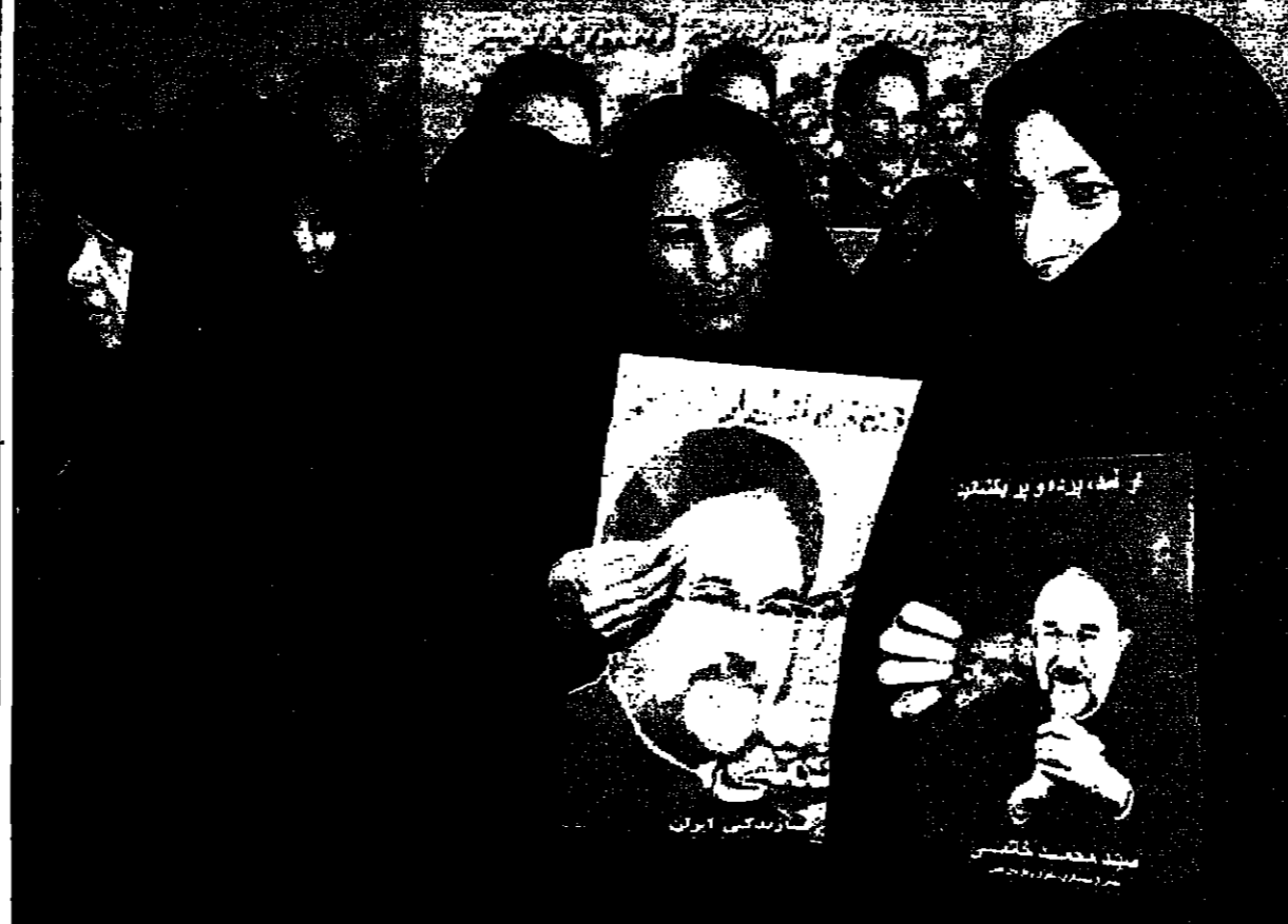
إيرانيات يحملن صور خاتمي أثناء الحملة الانتخابية

الأمم المتحدة - من طابوك، الأردن: قررت الجمعية العامة للأمم المتحدة في تصويت قريب من الإجماع يوم الأربعاء معاهدة دولية تهدف إلى ضمان الاستغلال العادل والرشيدي للمياه التي تجري في إقليم من دولتين. وكانت معاهدة المياه الدولية هي نتيجة لتفاوض بين مصر وسوريا واليمن، وهي ترمي إلى تنظيم استخدام المياه في نهر النيل بين هذه الدول الثلاثة.